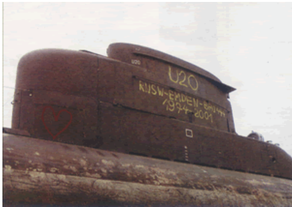
Letzte Reise nach Baden-Württemberg: der Turm von „U 20“.