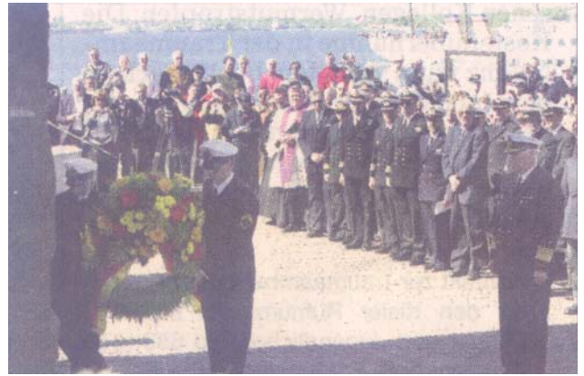
Mit einer Kranzniederlegung wurde am Ehrenmal in Möltenort der im Einsatz gestorbenen deutschen U-Bootfahrer gedacht.

Wer die U-Boote aus der Nähe sehen will, der hat heute Nachmittag in Eckernförde dazu die Gelegenheit. Die Marine öffnet von 13 bis 16 Uhr ihren U-Bootstützpunkt in Eckernförde im Kranzfelder Hafen. Dort können neben den U-Booten dann auch das Ausbildungszentrum sowie die Hafenanlagen des Geschwaders besichtigt werden. FB