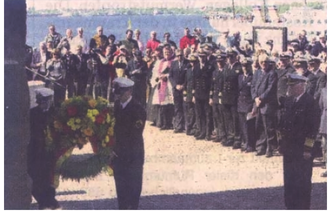
Mit einer Kranzniederlegung wurde am Ehrenmal in Möltenort der im Einsatz gestorbenen deutschen U-Bootfahrer gedacht.

Wer die U-Boote aus der Nähe sehen will, der hat heute Nachmittag in Eckernförde dazu die Gelegenheit. Die Marine öffnet von 13 bis 16 Uhr ihren U-Bootstützpunkt in Eckernförde im Kranzfelder Hafen. Dort können neben den U-Booten dann auch das Ausbildungszentrum sowie die Hafenanlagen des Geschwaders besichtigt werden. FB